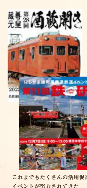
これまでもたくさんの活用促進イベントが努力されてきた

この「西尾ミライ新聞」は、市民の想像力から未来を考える小さなZINEです。まちは、行政だけが作るものでも、企業だけが作るものでもありません。そこに暮らす人たちが「こうだったらいいな」と思う気持ちや、日常の中の小さな会話や違和感の積み重ねが、少しずつ未来の形をつくっていくのだと思います。西尾には、海があり、抹茶があり、歴史があり、そして面白い人たちがたくさんいます。でも同時に、交通や人口、地域のこれらについて、いろいろな問いもあります。この新聞では、難しい議論だけではなく、くすつと突える一コマ漫画や、市民のお悩み相談、ちょっとしたアイデアや妄想も大事にし